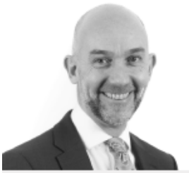
Adrian Crompton Archwilydd Cyffredinol Cymru

Mae hefyd yn nodi fy ffi archwilio amcangyfrifedig, manylion fy nhîm archwilio a dyddiadau allweddol ar gyfer cyflawni gweithgareddau ac allbynnau arfaethedig fy nhîm archwilio.